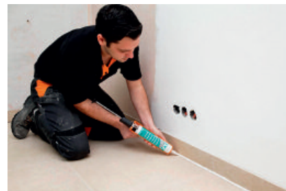
Elastisches Schließen von Boden-Wand-Fugen mit PCI Silcoferm S ohne störende Geruchsbelastigungen während und nach der Verarbeitung.